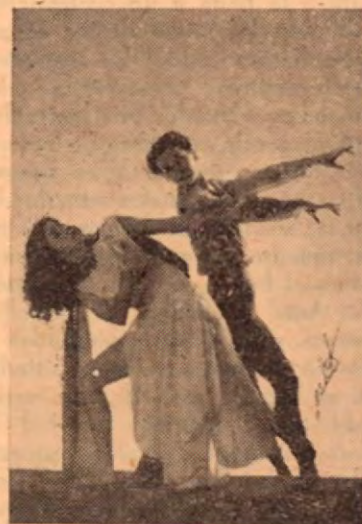
Una interpretación de "ARCILLA HUMANA"