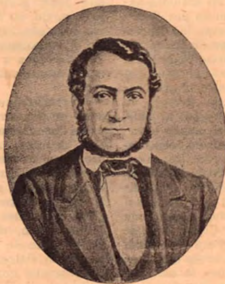
Don JUAN RAFAEL MORA