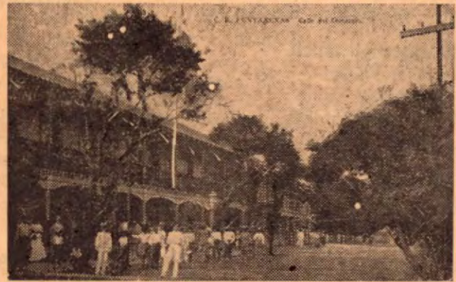
Puntarenas en 1898